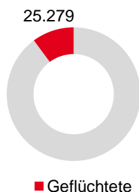
Arbeitslose Niedersachsen insg. 246.761